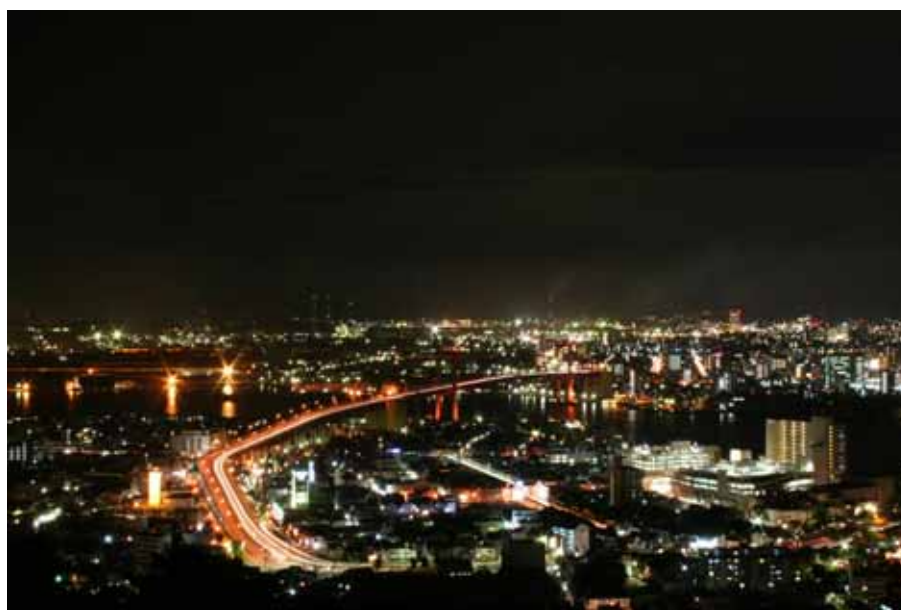
若戸大橋の夜景 若松側から

交換の際は、交換所窓口に来られた方の氏名・連絡先をお聞きしますのでご了承ください。